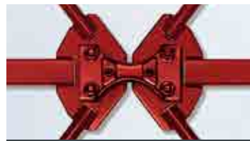
制震フレーム「ハイパワードクロス」