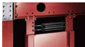
オイルダンパー制震装置「サイレス」